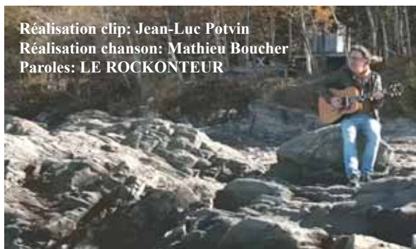
Réalisation clip: Jean-Luc Potvin Réalisation chanson: Mathieu Boucher Paroles: LE ROCKONTEUR