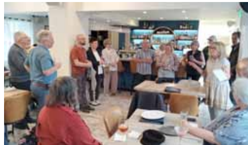
Déjà 1 an... À l'ouverture du 20 juin 2025

En tout temps durant les heures d'ouverture