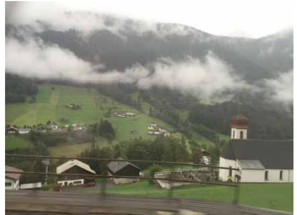
Tyrol, Autriche 2016

Remontée à Vienne, j'ai repris le train en utilisant mon billet de retour, qui même si j'arrêtais en chemin, n'occasionnait aucuns frais supplémentaires, car le trajet est une ligne directe avec au bout Vienne. Et alors j'arrivai à Salzbourg, MA VILLE!!! Ce fut le coup de foudre. J'y suis retournée 4 à 5 autres fois. Marcher dans les ruelles piétonnes de la vieille ville, visiter les magasins dont j'adore la mode, parler allemand et l'entendre, même si c'est en dialecte, furent un plaisir. Une copine de boulot, qui avait entendu parler de mon projet de voyage, me dit : « Tu dois absolument faire 3 choses à Salzbourg : aller au théâtre des marionnettes (j'y ai vu La Flûte enchantée de Mozart), aller voir la Forteresse HohenSalzburg, et manger un SalzburgerNockerl (elle ne voulait absolument pas me dire ce que c'était et en 1982, Google n'existait malheureusement pas). Alors comme je n'avais rien mangé avant, au cas où, et que j'avais bu un ballon (200ml) d'un excellent vin, je ne vous raconterai pas le retour pénible et gambadant à ma petite chambre d'hôtel, 10 minutes plus loin.... Par contre, je peux vous dire